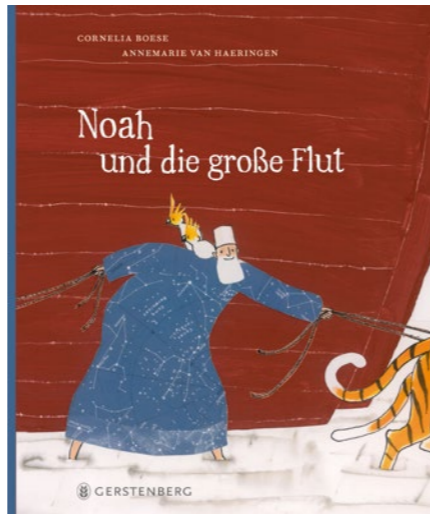
»Noah und die große Flut« (A. van Haeringen/Illustration C. Boese/Text) © 2017 Gerstenberg Verlag, Hildesheim

Im Buch »Noah und die große Flut« wird die Geschichte von der Schriftstellerin Cornelia Boese und der Künstlerin Annemarie van Haeringen erfrischend neu erzählt. Der Untergang der Menschheit und deren Rettung werden darin weder bagatellisiert noch dramatisiert. Die ausgestellten 15 Buchseiten zeigen einen vielfältig und leichtfüßig gestalteten Kosmos, der Lust darauf macht, mehr zu erfahren. In der Kombination aus einer klangvoller Reimform des (Ur-)Textes den Bildern in fließenden Aquarellfarben und Tuschezeichnungen können Kinder und deren Eltern die Schöpfung entdecken: Menschen, Tiere, Pflanzen und Fabelwesen tummeln sich in den Collagen. Darin finden sich Bedrohung und Tod, vor allem aber Glaube, Hoffnung und Liebe.