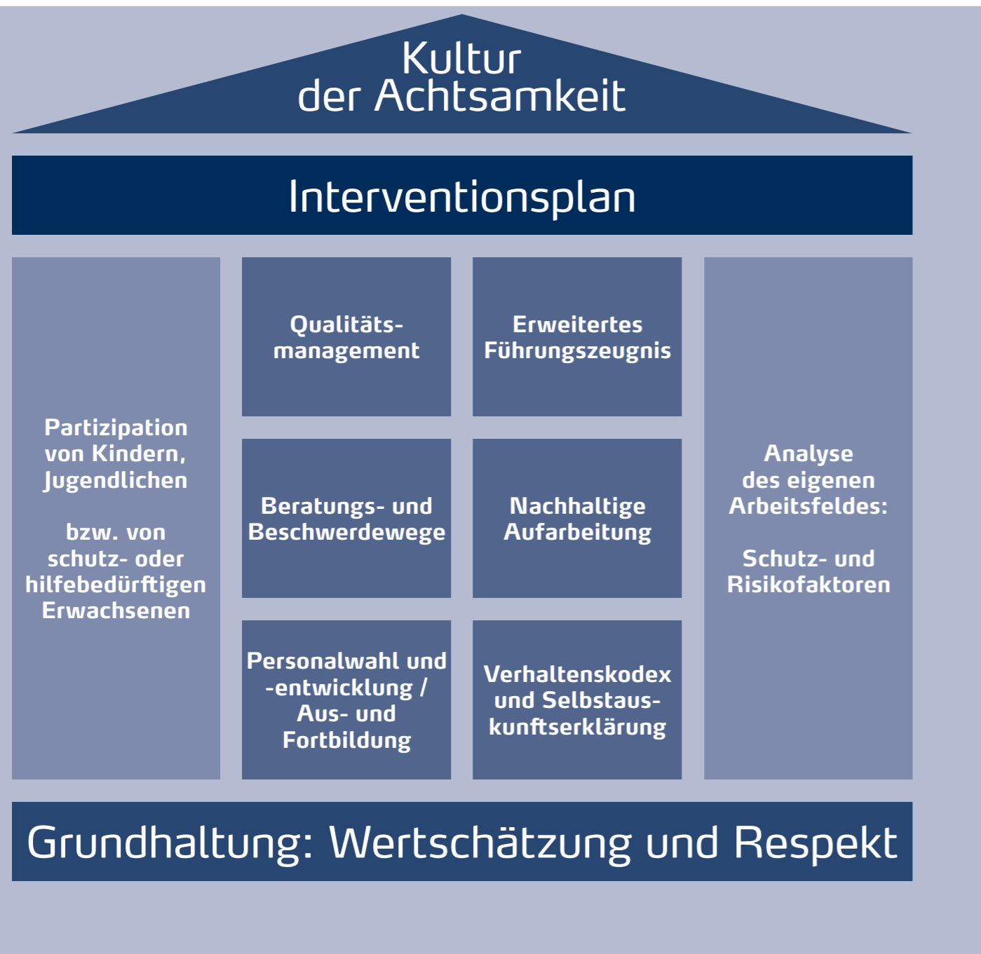
Abbildung 1: Institutionelles Schutzkonzept