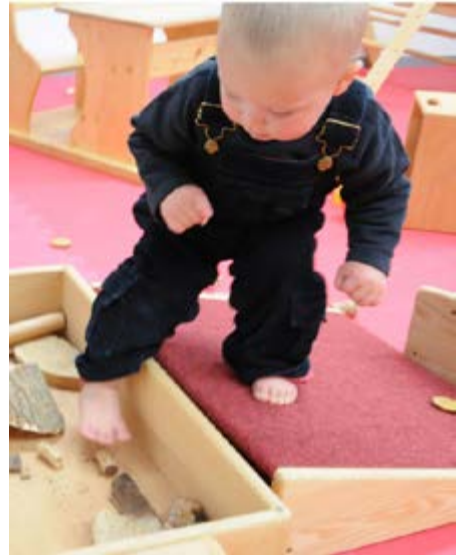
Dunker-179-EKK Piktler-Kind schiene Ebene-frei